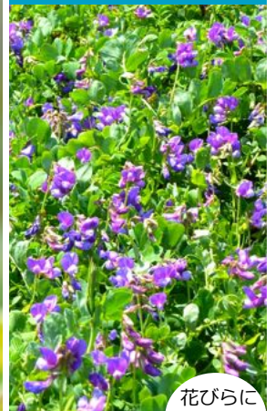
花びらにきれいな模様！