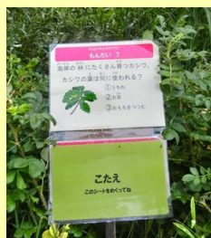
こんなパネルを7カ所さがしてまわろう!