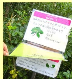
下のパネルをめくると答えがみられるよ