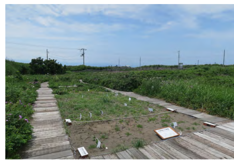
【(手前から奥に)砂浜からカシワ林にかけて生育する植物を配置した区画】